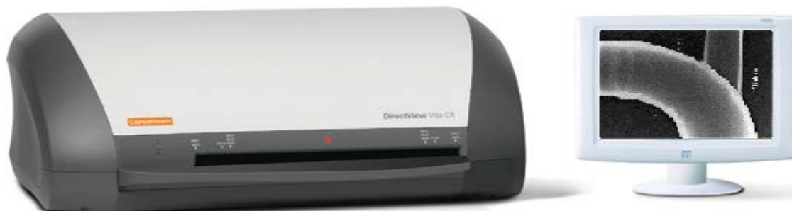
Vita CR システム